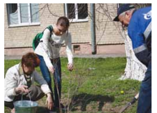
Сотрудники АО «Азовмежрайгаз» высаживают деревья.