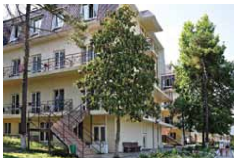
Корпус ДСОК «Радость».

В трехэтажном корпусе комнаты на 2-4 челове-