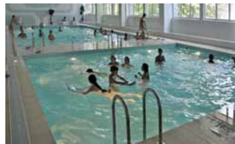
Бассейн ДСОК «Радость».

Конечно, условия проживания и полноценное питание подчас играют решающую роль в выборе, но отдых будет безрадостным и скучным