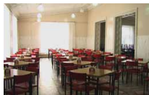
Столовая ДОЛСТ «Ока».

Номера: комнаты на 5-6 человек, душ, туалеты, умывальники расположены в каждом корпусе