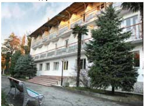
Корпус ДОКСТ «Дружба».

В четырехэтажном корпусе санузлы расположены в блоке из двух комнат. Комнаты на 2-3 человека.