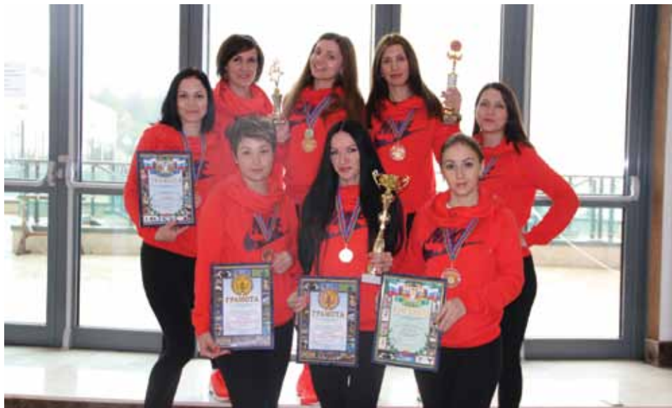
Волейбольная команда «Газпром межрегионгаз Ростов-на-Дону».