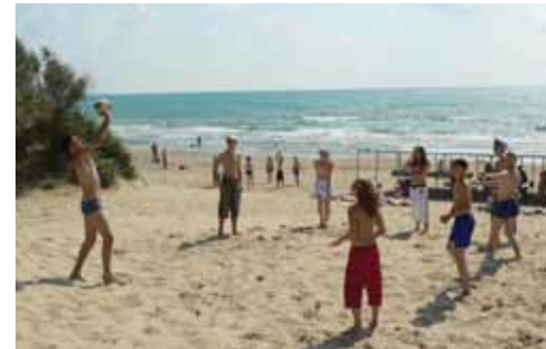
Пляж ДСЛ «Бимлюк».

Информацию о стоимости путевок можно получить, обратившись в первичную профсоюзную организацию предприятия. Фото лагерей можно посмотреть на сайте: www.sanator.ru .