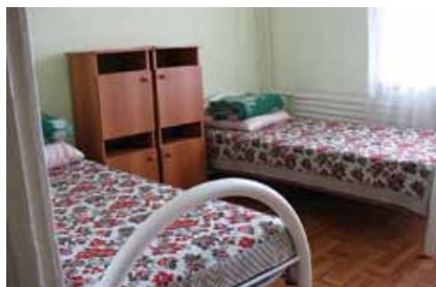
Комната ДСОЛ «Приморский».

Лагерь «Прорыв Поколения» — интересная тематика смен, экскурсии, удачное расположение