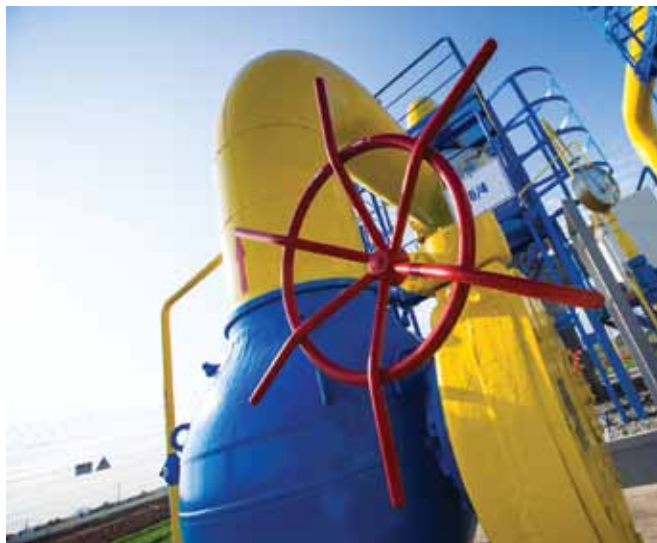
сетей, газифицировано 206 населенных пунктов. В результате к 1 января 2016 года уровень газификации в стране достиг 66,2%.

Если говорить о внутреннем рынке, то Газпром активно реализует программу газификации страны. В прошлом году построено 1275 км газопроводов-отводов и распределительных