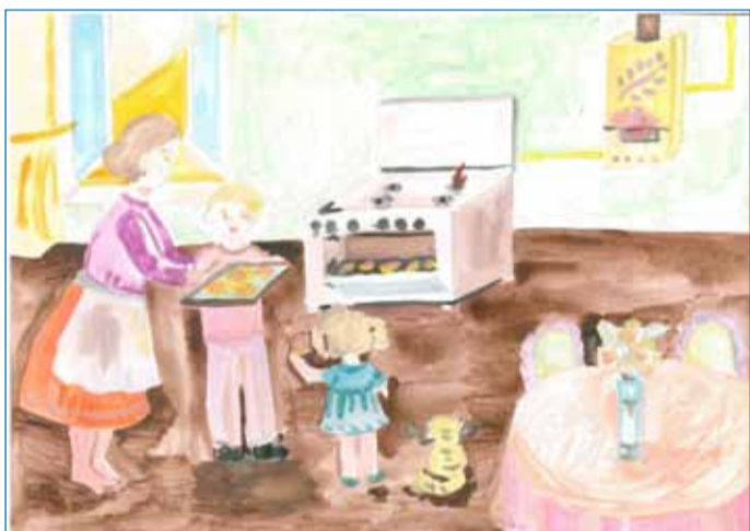
Павлова Катя (5 лет, Морозовск)