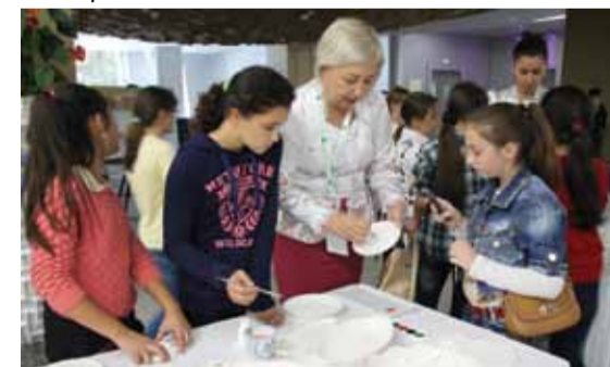
Мастер-класс по росписи Семикаракорской керамики для школьников г. Сочи.