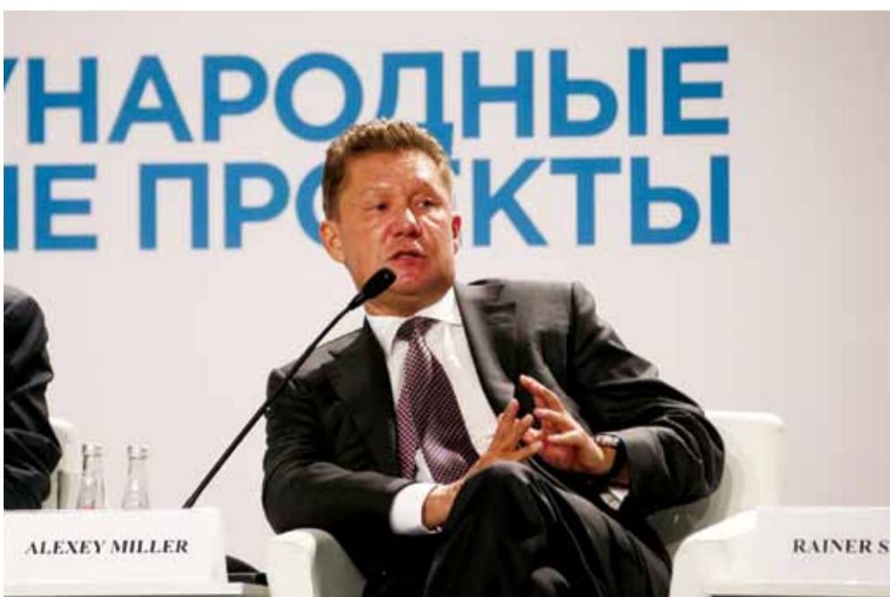
Председатель правления ПАО «Газпром» Алексей Миллер.

С 6 ПО 9 ОКТЯБРЯ В Г. САНКТ-ПЕТЕРБУРГЕ СОСТОЯЛСЯ V МЕЖДУНАРОДНЫЙ ГАЗОВЫЙ ФОРУМ, КОТОРЫЙ СТАЛ ЭФФЕКТИВНОЙ ПЛОЩАДКОЙ ДЛЯ ОБСУЖДЕНИЯ АКТУАЛЬНЫХ ПРОБЛЕМ ОТРАСЛИ. ПРОГРАММА ФОРУМА НАПРАВЛЕНА НА УКРЕПЛЕНИЕ СТАТУСА РОССИИ КАК ОДНОГО ИЗ КЛЮЧЕВЫХ ИГРОКОВ МИРОВОГО ГАЗОВОГО РЫНКА. РЕШЕНИЯ, ПРИНЯТЫЕ ЛИДЕРАМИ ИНДУСТРИИ ПО ИТОГАМ ДИСКУССИЙ НА ФОРУМЕ, НАПРЯМУЮ ВЛИЯЮТ НА ФОРМИРОВАНИЕ ГЛОБАЛЬНОГО ГАЗОВОГО РЫНКА.