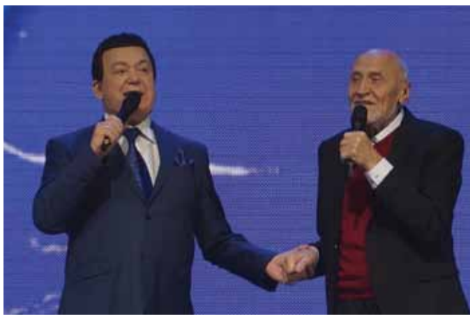
Народный артист СССР, депутат Государственной думы РФ И.Д. Кобзон; доктор биологических наук, профессор МГУ Н.Н. Дроздов на открытии первого международного экологического форума «У нас одна Земля. В гармонии с природой».