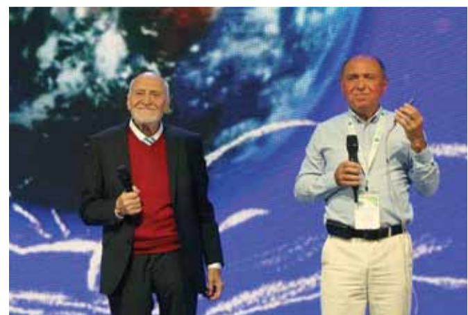
Прямое включение с международной космической станцией (МКС). На сцене слева-направо: ведущий программы «В мире животных» Н.Н. Дроздов, Герой Советского Союза, летчик-космонавт А.А. Волков.