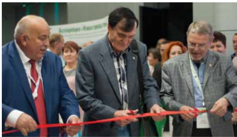
Директор «Ассоциации «Живая природа степи» В.И. Даньков, вице-президент Российского географического общества А.А. Чибилев, директор Берлинского зоопарка Клеменс Бекер (слева-направо) открывают фотовыставку в рамках первого международного экологического форума «У нас одна Земля. В гармонии с природой».