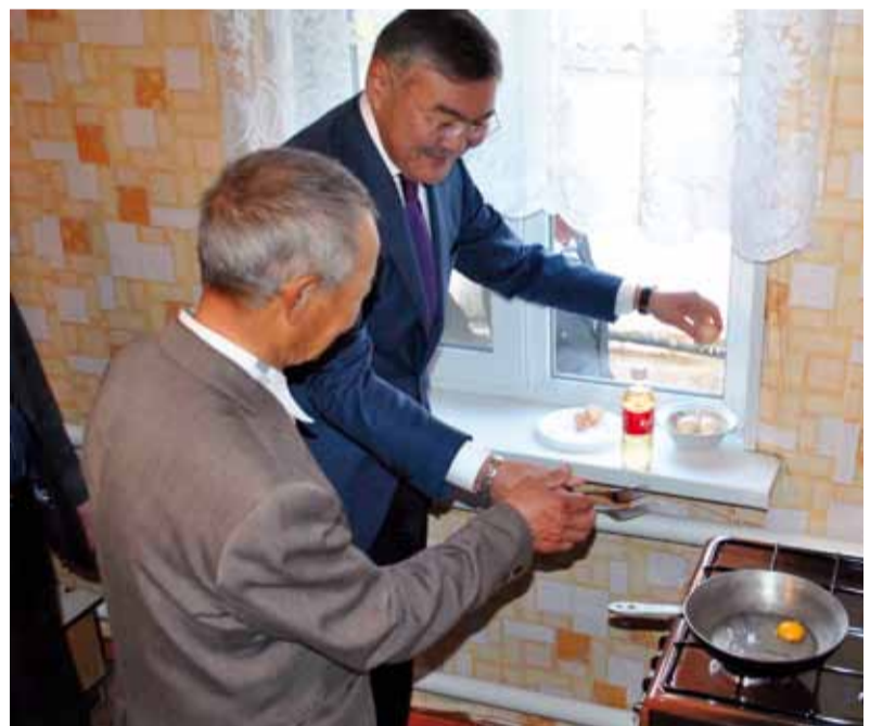
Глава республики Алексей Орлов (справа) жарит яичницу