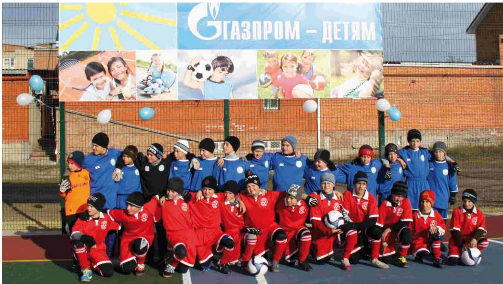
х. Жирнов, Тацинский район