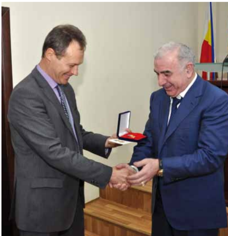
Зам. министра промышленности и энергетики Е. Прусов (слева) вручает награду А. Джиеву

Полностью перевооружена и оснащена самым современным оборудованием аварийно-диспетчерская служба, обновлен автомобильный парк. Развивается система газораспределения города, стартовало строительство новых, а также модернизация существующих источников газоснабжения, рекон-