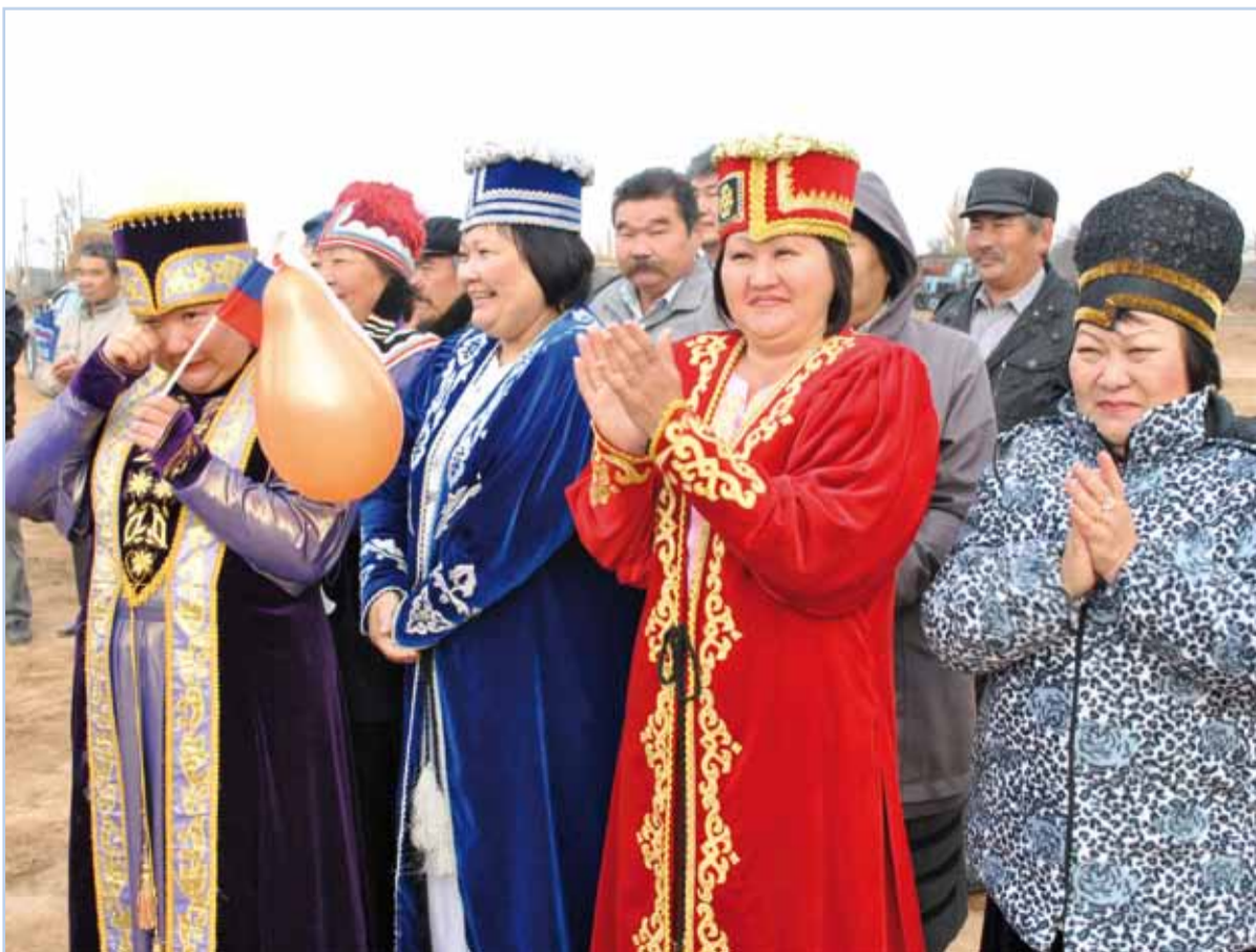
Жители села на празднике