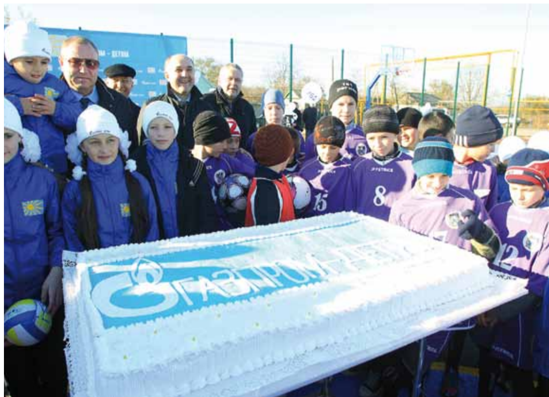
с. Лопанка, Целинский район

В НОЯБРЕ В РАМКАХ ПРОГРАММЫ «ГАЗПРОМ – ДЕТЯМ» В СЕЛЬСКИХ РАЙОНАХ РОСТОВСКОЙ ОБЛАСТИ БЫЛИ ОТКРЫТЫ 5 СПОРТИВНЫХ ПЛОЩАДОК В КОНСТАНТИНОВСКОМ, ТАЦИНСКОМ, ПРОЛЕТАРСКОМ, ЦЕЛИНСКОМ И В БЕЛОКАЛИТВИНСКОМ РАЙОНАХ.