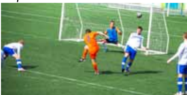
Гол не пропустим.