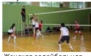
Женская волейбольная команда.