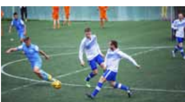
Борьба за мяч.