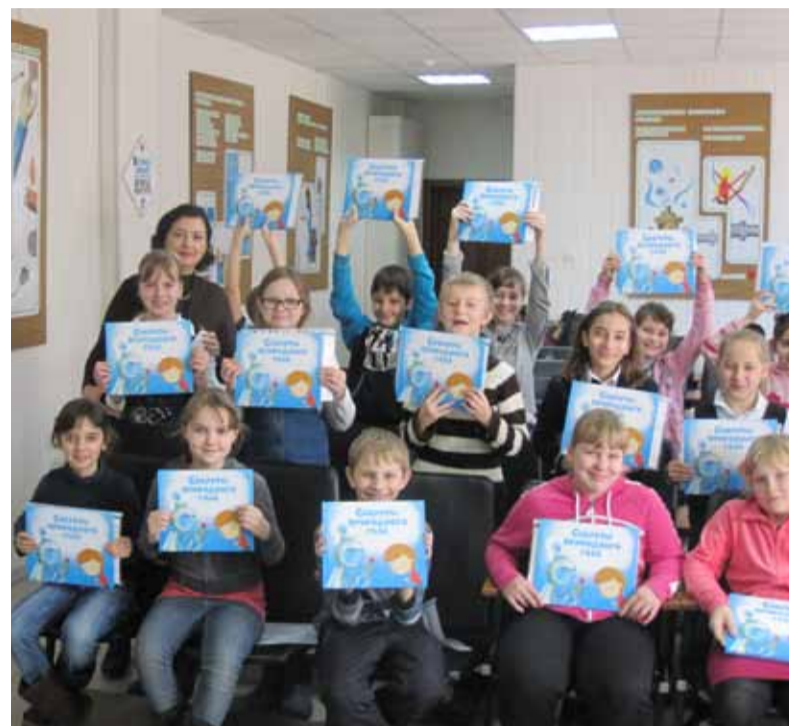
Газовики в гостях в детском доме.

Для ребят стало приятным сюрпризом вручение дипломов агентов домашней безопасности и