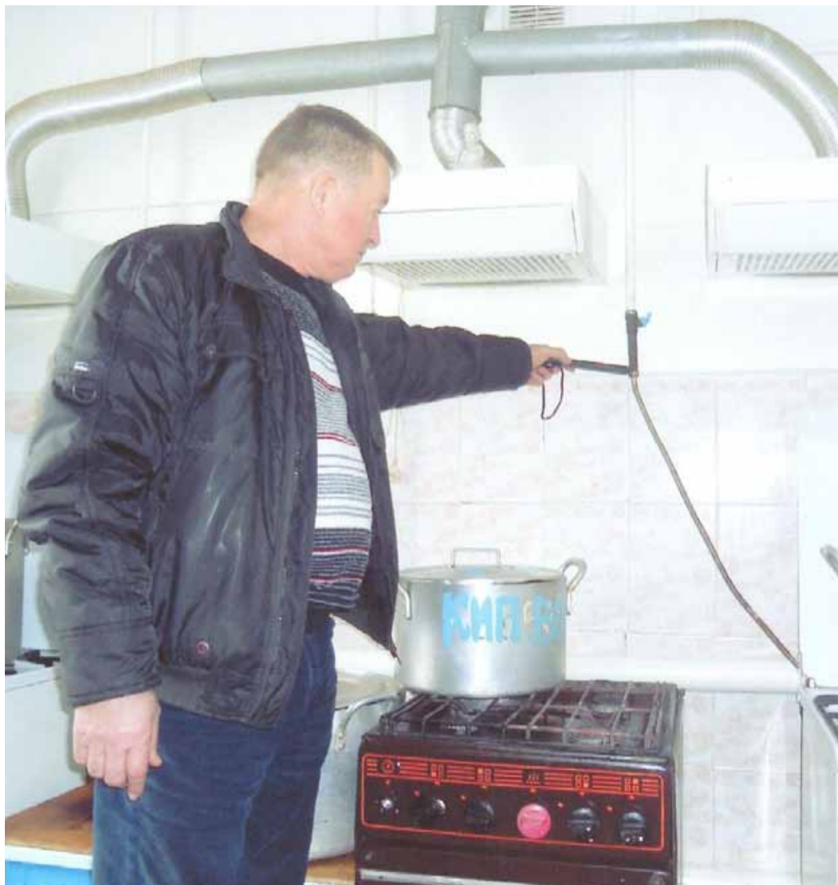
Проверка газового оборудования.

Поводом к проверке послужила аварийная ситуация в одном из пригородных муниципальных детских садов. В результате грубых нарушений правил пользования газовым оборудованием (были перекрыты заслонки на дымоходах газовых форсунок) угарный газ начал поступать в спальное помещение, где в это время находились дети. Бригада «04» оперативно локализовала аварийную ситуацию, специалисты ВДГО при дальнейшем осмотре выявили ряд других нарушений правил безопасности при эксплуатации газового оборудования. Договор на техническое обслуживание внутридомового газового оборудования отсутствовал.