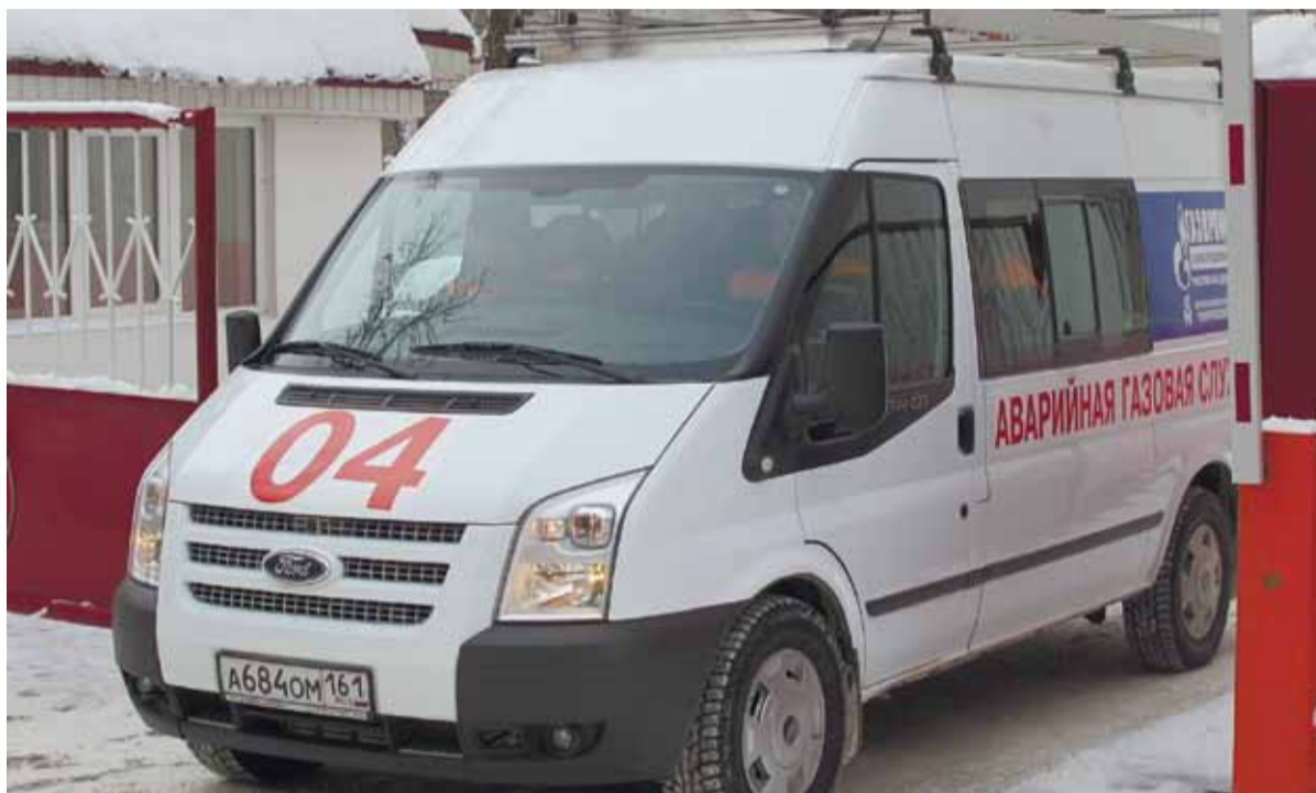
Аварийная газовая служба.