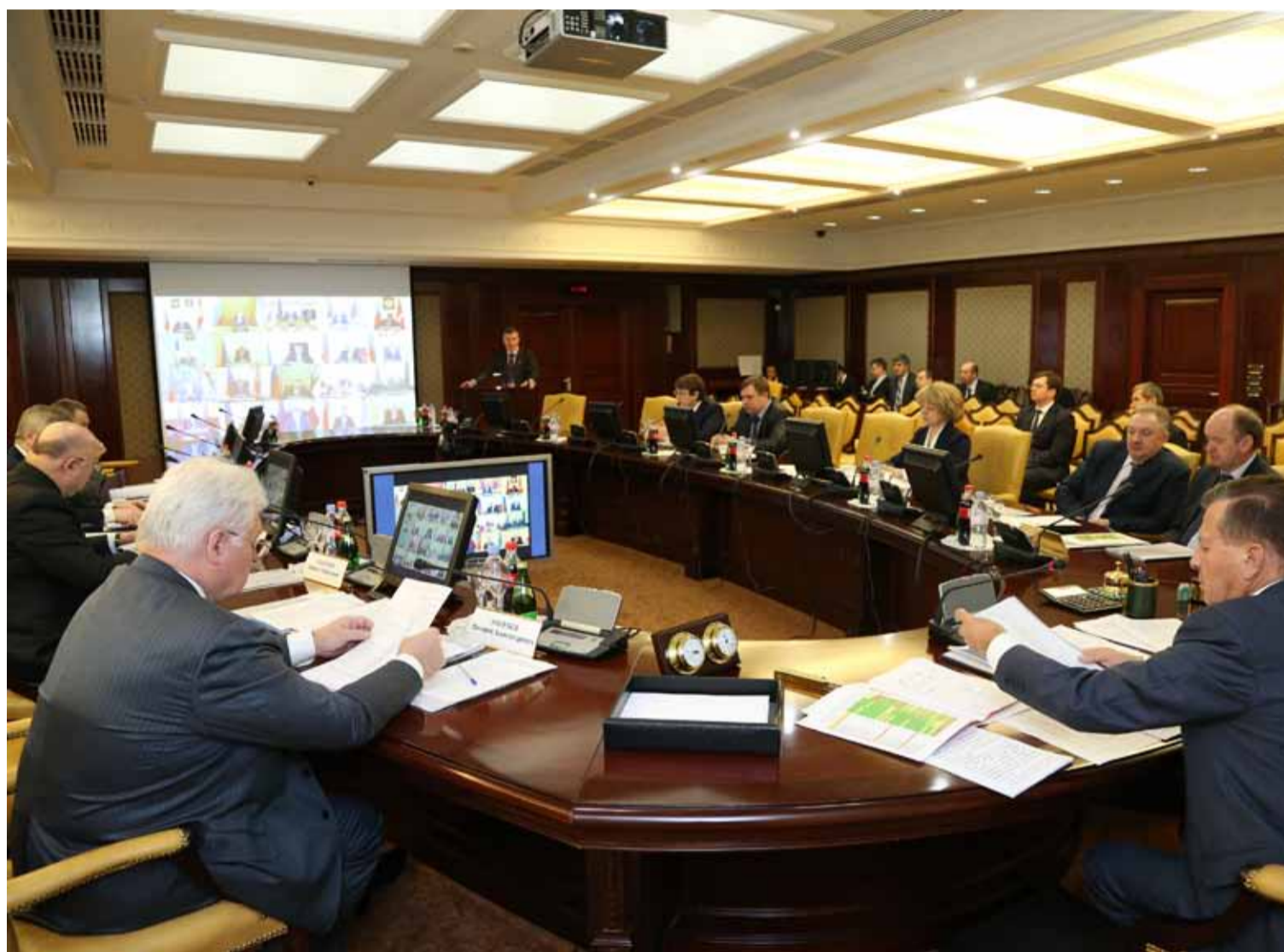
Селекторное совещание по вопросам укрепления платежной дисциплины при оплате за газ.

РОСТ НЕПЛАТЕЖЕЙ ЗА ПОСТАВЛЕННЫЙ ГАЗ СТАВИТ ПОД УГРОЗУ РАЗВИТИЕ ГАЗИФИКАЦИИ В РОССИИ И ИНВЕСТИЦИОННУЮ ПРИВЛЕКАТЕЛЬНОСТЬ РЕГИОНОВ