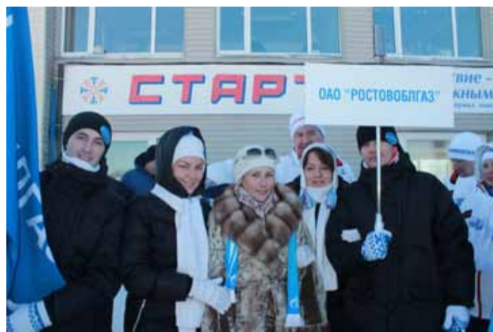
С олимпийской чемпионкой Ю. Чепаловой.