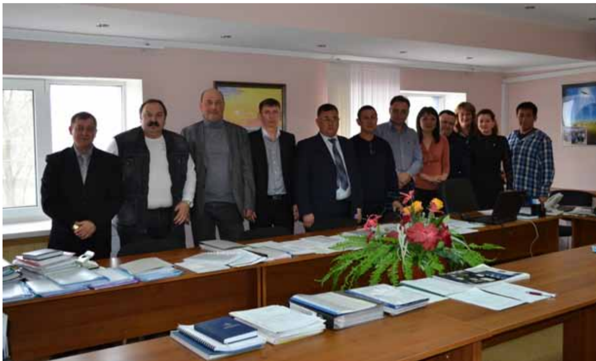
Первичная профсоюзная организация ОАО «Калмгаз»

Группа по связям с общественностью и СМИ ОАО «Калмгаз»