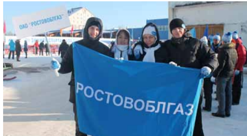
Команда ОАО «Ростовоблгаз».