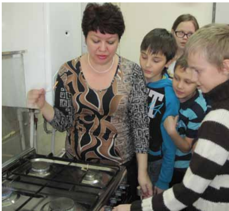
Газовики в гостях в детском доме.

Школьникам показали учебный мультфильм, в котором в доступной форме говорится о серьезных последствиях невнимательного отношения к газовым приборам в жилых домах. Просмотр мультфильма, а также использование во время занятия красочных наглядных пособий оказали учащимся значительную помощь в закреплении теоретического материала.