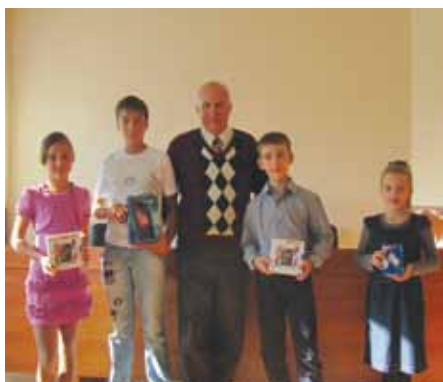
Награждение участников конкурса в филиале ОАО «Газпром газораспределение Ростов-на-Дону» в г. Белая Калитва