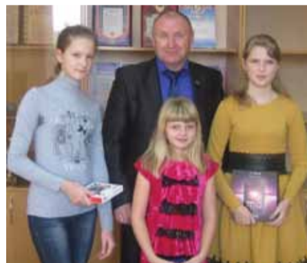
Награждение участников конкурса в филиале ОАО «Газпром газораспределение» в г. Морозовске

В нашей компании приняли участие в конкурсе более 40 детей. Три лучшие работы были отправлены в ОАО «Газпром газораспределение» г. Санкт-Петербург. Остальные ребята получили поощрительные призы.