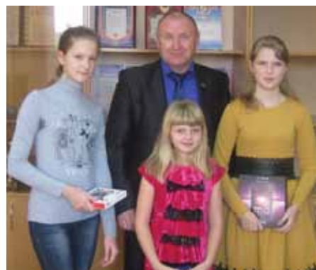
Награждение участников конкурса в филиале ОАО «Газпром газораспределение» в г. Морозовске

В нашей компании приняли участие в конкурсе более 40 детей. Три лучшие работы были отправлены в ОАО «Газпром газораспределение» г. Санкт-Петербург. Остальные ребята получили поощрительные призы.