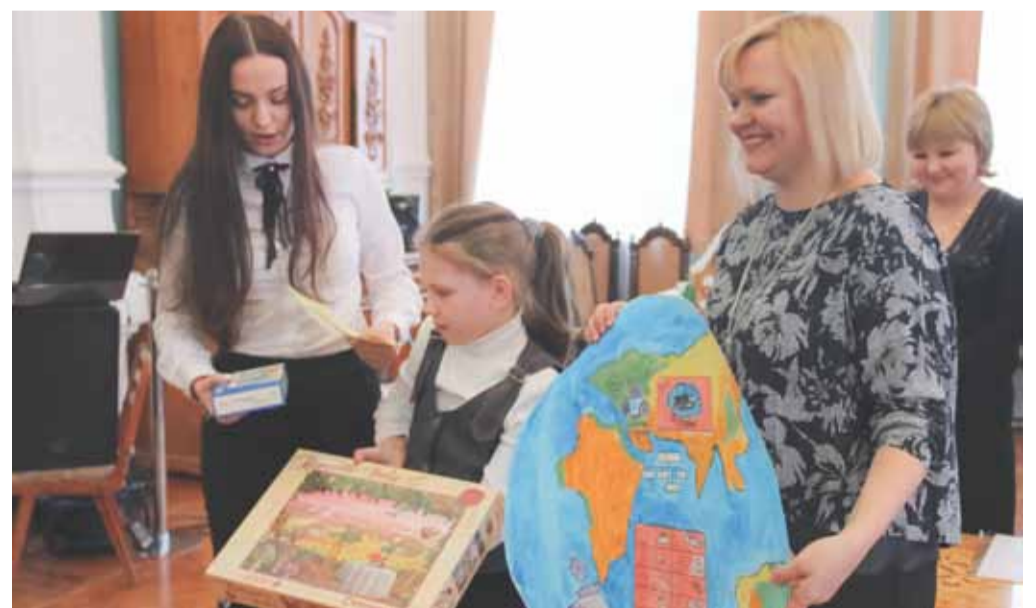
Награждение победителей конкурса детского рисунка.

В КОНЦЕ 2015 ГОДА ТЕЛЕКОМПАНИЕЙ «АНТА» ПРИ ПОДДЕРЖКЕ АО «АЗОВМЕЖРАЙГАЗ» БЫЛ ПРОВЕДЕН ЕЖЕГОДНЫЙ КОНКУРС ДЕТСКОГО РИСУНКА, В РАМКАХ КОТОРОГО СОТРУДНИКИ ГАЗОВОЙ КОМПАНИИ ПРЕДСТАВИЛИ НОМИНАЦИЮ «АГЕНТ ДОМАШНЕЙ БЕЗОПАСНОСТИ».