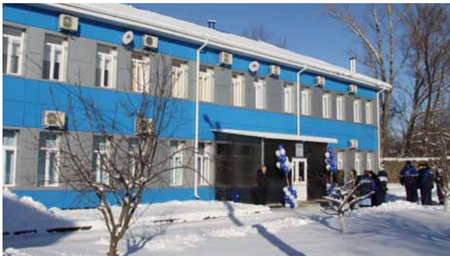
Новое административное здание Красносулинского районного газового участка.

В ПРЕДДВЕРИИ НОВОГОДНИХ ПРАЗДНИКОВ 117 СОТРУДНИКОВ КРАСНОСУЛИНСКОГО РАЙОННОГО ГАЗОВОГО УЧАСТКА ФИЛИАЛА ПАО «ГАЗПРОМ ГАЗОРАСПРЕДЕЛЕНИЕ РОСТОВ-НА-ДОНУ» В Г. НОВОШАХТИНСКЕ ПОЛУЧИЛИ ПОДАРОК - НОВОЕ ОТРЕМОНТИРОВАННОЕ АДМИНИСТРАТИВНОЕ ЗДАНИЕ.