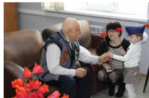
Поздравление ветеранов ВОВ в г. Батайске.