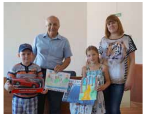
Награждение участников конкурса рисунков.

По сложившейся традиции в канун Дня защиты детей профсоюзная организация филиала ПАО «Газпром газораспределение Ростов-на-Дону» в г. Белая Калитва провела конкурс детских рисунков на тему: «Мой любимый край». В своих рисунках ребята с помощью творческой фантазии отразили красоту родного края. Рисунки получились красочные и интересные. Итоги конкурса были подведены 03 июня 2015 года. Все участники были награждены памятными призами.