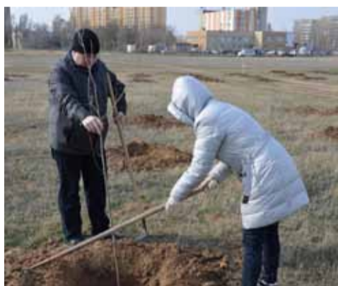
День древонасаждения в г. Волгодонске.

В рамках акции приуроченной ко Дню древонасаждения, 28 марта сотрудники АО «Волгодонскмежрайгаз» приняли участие в закладке аллеи «Крымская Весна» на территории парка «Молодежный» (г. Волгодонск), название которой, отсылает к событиям 2014 года в Крыму и Севастополе. Аллея расположена от проспекта Курчатова вглубь поля в сторону храма Рождества Христова. Участниками акции было посажено 336 саженцев клена, акации и тополей.