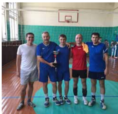
Волейбольная команда филиала ПАО «Газпром газораспределение Ростов-на-Дону» в г. Миллерово.