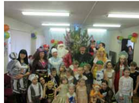
Новогодний праздник в филиале ПАО «Газпром газораспределение Ростов-на-Дону» в г. Аксай.

В филиале ПАО «Газпром газораспределение Ростов-на-Дону» в г.Аксае сложилась добрая традиция, в преддверии Нового года радовать детей и взрослых Новогодним представлением.